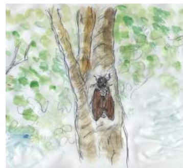
アブラゼミ 中洲慧氏画