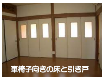
車椅子向きの床と引き戸

(2) 家内安全 ：バリアフリー／ヒートショック対策で、安全・健康面でも安心の我が家に致しましょう。室内での移動の際の段差の解消や手すりの設置、更に車椅子で利用できるトイレ等、何なりとご相談下さい。また、自宅内で温度差が生じやすく、ヒートショックの心配がある洗面所、浴室、トイレ等の場所にも最適な設備を提案させていただきます。