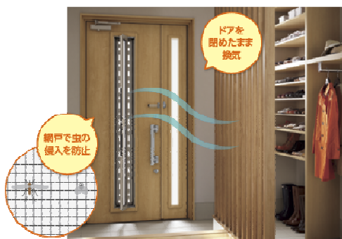
ドアを 開けたまま 換気