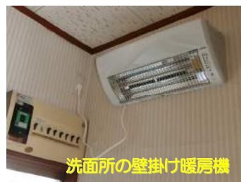
洗面所の壁掛け暖房機

(3) ペットも家族の一員 ：犬・猫・小鳥等の室内で飼える小動物との生活は心癒される毎日となります。ペット臭や有害物質の軽減、滑りにくい床等、ペットと人が共に快適に過ごせる空間を考慮しましょう。