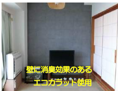
壁に消臭効果のある エコカラット使用

(3) ペットも家族の一員 ：犬・猫・小鳥等の室内で飼える小動物との生活は心癒される毎日となります。ペット臭や有害物質の軽減、滑りにくい床等、ペットと人が共に快適に過ごせる空間を考慮しましょう。